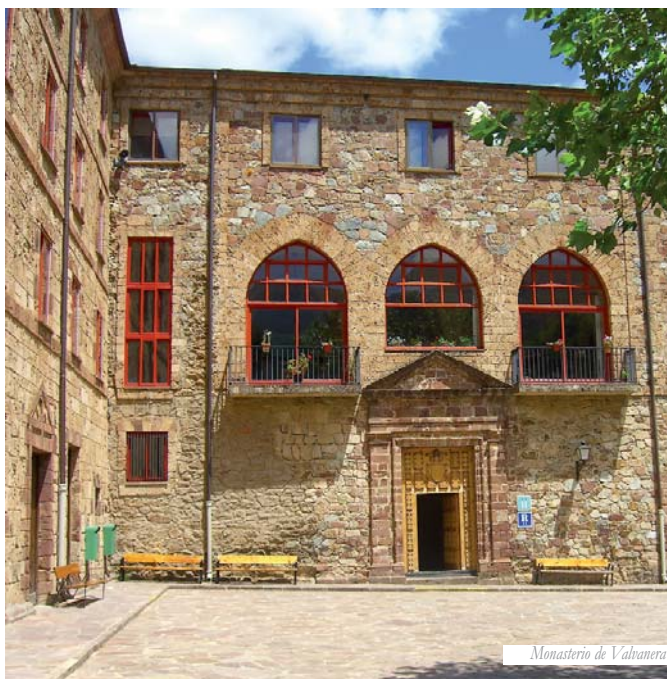
Monasterio de Valvanera

SALIDAS DESDE: BARCELONA, LÉRIDA, MADRID, ANDALUCÍA, COM. MURCIANA, CASTILLA LA MANCHA Y COM. VALENCIANA