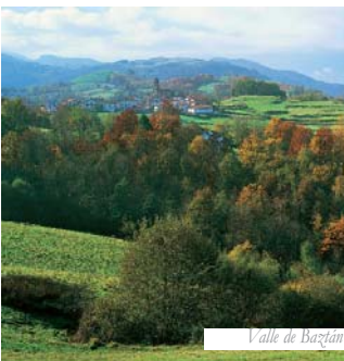
Valle de Baztan

Hotel acogedor, de trato familiar, profesional y personalizado. Cuenta con una decoración moderna que combina materiales de acero con madera de cerezo. Situado en una área privilegiada de Pamplona, cerca del centro histórico y en plena área de negocios.