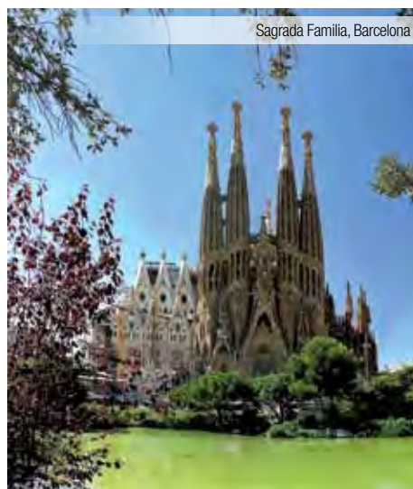
Sagrada Família, Barcelona

Desayuno en el hotel y excursión incluida a Figueras, capital de la Comarca del Alto Ampurdán. Regreso al hotel para el almuerzo y por la tarde excursión incluida a Blanes, conocido como el "Portal de la Costa Brava", donde destacamos sus jardines botánicos Marimurtra y Pinya de Rosa, los cuales se puede acceder con el "carrilet", un trenecito que además hace un tour por la villa (entradas no incluidas). A la hora indicada regreso al hotel, cena y alojamiento.