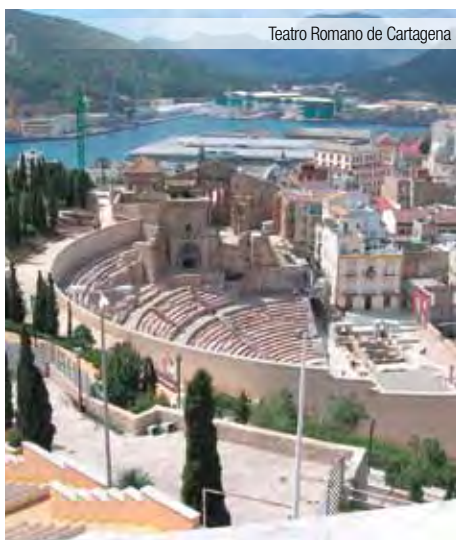
Teatro Romano de Cartagena

Situado en una zona tranquila, a un corto paseo del centro histórico y comercial de Murcia, cerca de la Plaza Circular y del Parque Atalayas, a 10 minutos del casco antiguo. Ofrece conexión inalámbrica a internet gratuita. Las habitaciones del hotel son elegantes y sencillas, con minibar y aire acondicionado.