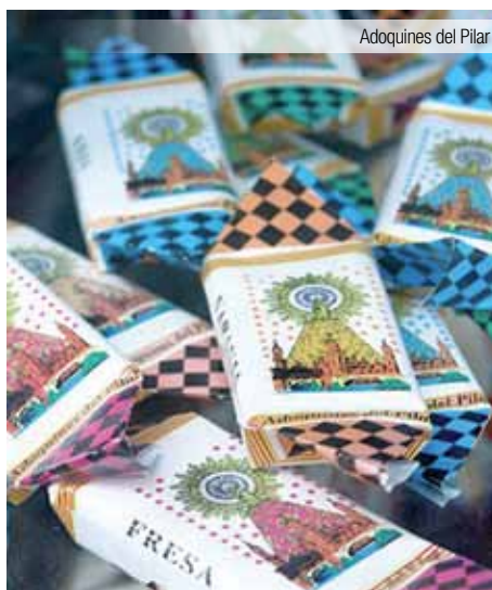
Adoquines del Pilar

Desayuno. Por la mañana, excursión a la ciudad de Tarazona, reedificada por el conocido héroe mitológico Hércules. Tendremos tiempo