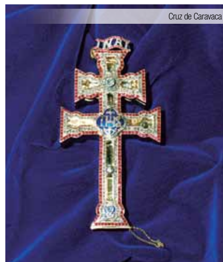
Cruz de Caravaca

Desayuno y regreso a las ciudades de origen