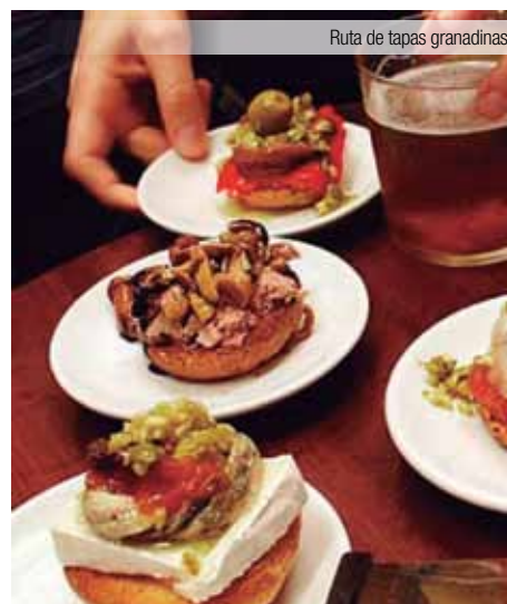
Ruta de tapas granadinas

HOTEL URBAN DREAM **** GRANADA Situado a 10 minutos a pie de la catedral y del centro de Granada, ofrece habitaciones modernas con conexión WiFi gratuita y alberga una cafetería abierta las 24 horas. Habitaciones con decoración contemporánea e incluyen aire acondicionado, TV de pantalla plana vía satélite, minibar y secador de pelo.