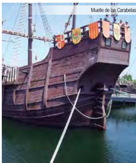
Muelle de las Carabelas

Desayuno y excursión incluida para conocer acompañados por un guía oficial la ciudad de Huelva, donde realizaremos una visita panorámica, visitaremos el Santuario de la Virgen de la Cinta, continuaremos viaje para visitar Las Marismas del Odiel, con sus dos reservas naturales, "Marismas del Burro" e "Isla de Enmedio". Regreso al hotel para el almuerzo, por la tarde nos desplazaremos a Ayamonte población situada a orillas del Guadiana, para realizar un recorrido en barco por el Guadiana (entradas incluidas), hasta llegar a Vila Real de Santo Antonio, municipio turístico donde destaca su comercio. Regreso al hotel, cena y alojamiento.