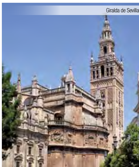
Giralda de Sevilla

Incluidas Entradas para Alhambra Jardines, Generalife y Alcazaba. Esta visita incluye todos los espacios visitables del Monumento, a excepción de los Palacios Nazaríes.