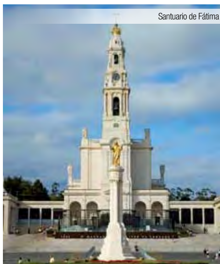
Santuario de Fátima

Desayuno en el hotel y excursión incluida de día completo a Oporto con almuerzo en restaurante incluido. Junto a la des-