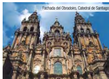
Fachada del Obradoiro, Catedral de Santiago

PRECIO POR PERSONA Y CIRCUITO EN HAB. DOBLE