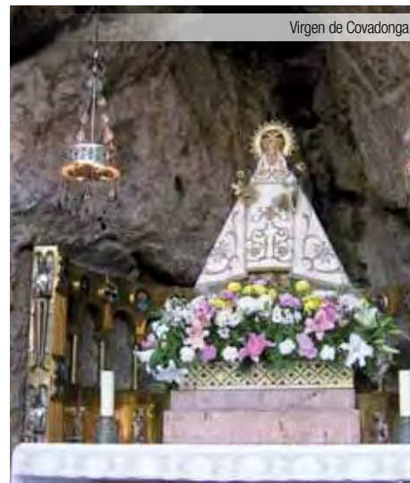
Virgen de Covadonga

Desayuno en el hotel y salida a las 5 de la mañana (salvo indicación contraria por parte del asistente en destino) hacia el punto de origen. Breves paradas en ruta (almuerzo por cuenta de los señores clientes). Llegada y fin de nuestros servicios.