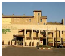
El Barco de Ávila HOTEL REAL DE BARCO ***