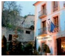
Sepúlveda (Segovia) HOTEL VADO DEL DURATÓN ***

"ESCAPADA ROMÁNTICA" PRECIOS PAX/PAQUETE ✓ INCLUYE 1 Ó 2 NOCHES EN AD: ● Parking gratuito. ● Internet gratuito. ● Atención de bienvenida. ● 10% dto. en comidas o cenas a la carta en nuestro Restaurante Claustro. ● Late check out hasta las 15:00 hrs. Niños 0-11 años gratis.