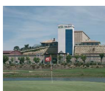
Villamayor de Arnuña (Salamanca) HOTEL SALAMANCA FORUM RESORT - H. DOÑA BRÍGIDA ****