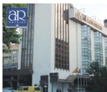
Segovia HOTEL AR LOS ARCOS ***

"CULTURAL-GASTRONÓMICA VISITA GUIADA" PRECIOS PAX/PAQUETE ✓ INCLUYE 2 NOCHES MP: ● 1er día: cena y alojamiento en el hotel. ● 2º día: Desayuno, 11.45 Visita Guiada a la ciudad de Segovia (2h y 15 min.) con un mínimo de 4 pax. Cena en el restaurante Casa Cándido, alojamiento. Spto. individual 52,50 €/noche. Precio 3ª pax adulta 111,25 €/noche. Consultar ESCAPADA VISITA AL ALCÁZAR Y CULTURAL-GASTRONÓMICA.