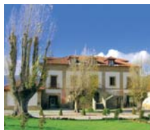
El Barco de Ávila HOTEL IZÁN PUERTA DE GREDOS ****