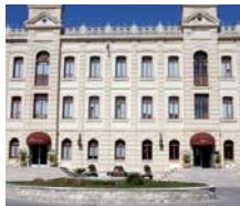
Peñañiel (Valladolid) HOTEL RIBERA DEL DUERO ***

"ESCAPADA GASTRONÓMICA-CULTURAL" PRECIOS PAX/PAQUETE ✓ INCLUYE 2 NOCHES EN AD: ● 2 noches de domingo a viernes. ● Desayuno buffet. (ocasionalmente podrá servirse en mesa). ● Dulces y cava de bienvenida. ● 1 Cena típica castellana con degustación de cochinillo o cordero asado (según dispo.) y vinos de la zona. ● Visita al Centro de Interpretación del Parque Natural de las Hoces del Río Duratón y visita al Museo de los Fueros de Sepúlveda (Lunes cerrado).