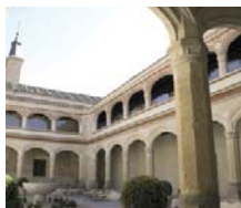
Segovia HOTEL SAN ANTONIO EL REAL ****

"ESCAPADA GOURMET" PRECIOS PAX/PAQUETE ✓ INCLUYE 1 Ó 2 NOCHES EN AD: ● Detalle de bienvenida en la habitación. ● Cena o almuerzo con menú típico segoviano en restaurante "La cocina de Segovia". Consultar menú. ● Libre acceso a la sauna y Gimnasio ● Late check out según disponibilidad