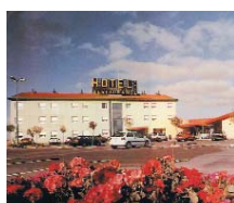
Villagonzalo Pedernales (Burgos) HOTEL REY ARTURO ***