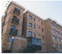
Segovia HOTEL CORREGIDOR **

PRECIOS POR PERSONA Y PAQUETE ✓ INCLUYE 2 NOCHES: ESCAPADA ROMÁNTICA: ● Botella cava en la habitación. ● 2 desayunos. ● 1 acceso al spa. ● 1 tratamiento de hidroterapia. ESCAPADA GASTRONÓMICA Y RELAX: ● 2 desayunos. ● 2 Cenas. ● 1 Acceso al spa. ESCAPADA MOMENTOS ESPECIALES: ● 1 Cena menú. ● 1 Cena degustación. ● 1 Acceso al spa. ● 1 Tratamiento de hidroterapia. Bebidas no incluidas en los menús.