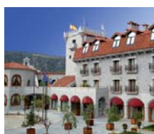
Bohoyo (Ávila) HOTEL REAL DE BOHOYO *****GL