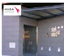
Burgos HOTEL HUSA ARLANZÓN ***