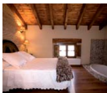
Villalpando (Zamora) HOTEL POSADA REAL LOS CONDESTABLES

PRECIOS POR PERSONA Y NOCHE ✓ INCLUYE 1 NOCHE EN AD: ESCAPADA RELAX DELUXE: ● Detalle de Bienvenida en la hab. ● Un Circuito Termal para 2 pax en el SPA del hotel (imprescindible cita previa) ● Un masaje combinado (a elegir) por persona en el SPA (imprescindible cita previa). ESCAPADA RELAX INTEGRAL: ● Detalle de Bienvenida en la hab. ● Un Circuito Termal para 2 en el SPA del hotel (imprescindible cita previa) ● Un Programa Relax (Estrella o Desestresante) en el SPA (imprescindible cita previa). Consultar ESCAPADA EN LA RIBERA.