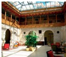
Peñañiel (Valladolid) HOTEL CONVENTO LAS CLARAS ****

"ESCAPADA PAQUETE ENOLÓGICO" PRECIOS PAX/NOCHE ✓ INCLUYE 1 NOCHE EN AD: ● Comida en el restaurante La Harinera. ● Visita guiada a la bodega Legaris con degustación de vinos. ● Visita al castillo de Peñañiel que actualmente alberga el Museo Provincial del Vino.