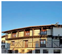
Mogarráz (Salamanca) HOTEL SPA VILLA DE MOGARRAZ ****