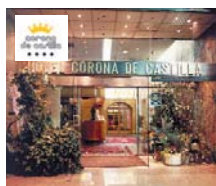
Burgos HOTEL CORONA DE CASTILLA ****