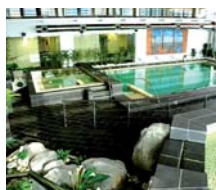
Mazarrón HOTEL SENSOL ****