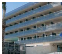
S. Pedro del Pinatar HOTEL H. THALASIA & THALASSO CENTER ****

PRECIOS POR PERSONA Y PAQUETE EN AD ✓ INCLUYE 2 Ó 3 NOCHES EN AD en hab.doble. ESCAPADA DESCANSO E HISTORIA ● 3 noches en AD. ● 1 circuito Spa de dos horas, entrada libre a gimnasio, salida de la habitación a las 18:00 hrs.(segun disponibilidad) Mas entradas para visita turística a Cartagena puerto de culturas teatro Romano, muralra punica y castillo. ESCAPADA RELAX: ● 2 noches en AD. ● 1 circuito spa de 2 horas, entrada libre al gimnasio, salida de la habitación a las 18:00 hrs.(segun disponibilidad)