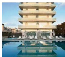
S. Pedro del Pinatar HOTEL LODOMAR ****

"ESCAPADA FIN DE SEMANA" PRECIOS POR PAX/PAQUETE ✓ INCLUYE 2 NOCHES en habitación doble. ● 1 pase al centro de Thalasso a disfrutar durante la estancia (no está permitida la entrada en el Thalasso a niños menores de 12 años). ● En la entrada al Centro de Thalasso se incluye albornoz y toalla (con fianza), zumos e infusiones gratis. ● Parking gratis (según disponibilidad) y late check-out (según disponibilidad). ● Precio noche extra en AD (sin otro servicio): del 1-31/5 y 1-31/10: 30 €, del 1-30/6 y 1-30/9: 40 €, del 1-31/7: 50 € y del 1-31/8: 60 €/pax/noche, spto MP: 20 € y PC: 40 €/pax/noche. Spto. Individual consultar. ● Consultar ESCAPADAS RELAX Y PARQUE TEMÁTICO.