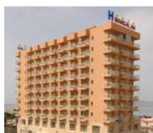
La Manga HOTEL MANGALÁN ****

ESCAPADAS SENSOL: PRECIOS POR PERSONA Y PAQUETE DE 2 NOCHES METAL: ● 1 acceso recorrido de aguas por persona. ● 1 acceso fitness ilimitado. ● 1 masaje de 30 minutos por persona. Spto. hab. Junior Suite por hab. 60 €. LOOK: ● 1 acceso recorrido de agua por persona. ● 1 manicura para ella, 1 limpieza facial para él. ● 1 pedicura para ella, 1 peeling de manos para él. ● 1 masaje relajante de 30 minutos por persona. ● 1 tratamiento adecuado a su tipo de piel. TROPICAL: ● 2 accesos "recorridos de agua" por persona. ● 1 envolvimento de frutas tropicales por persona. ● 1 masaje aromático de maracuya por persona. ● 1 flotarium de 30 minutos por persona. FIN DE SEMANA: ● 1 visita medica de inicio. ● 2 accesos "recorrido de aguas" por persona. ● 1 Exfoliación profunda e hidratante por persona. ● Balneoterapia relajante por persona. ● 1 Envolvimento de algas por persona. ● 1 masaje relajante por persona. ENAMORATE: ● 1 coctel sensol. ● 1 cena romantica en Rte. Sensol. ● 1 masaje aromático los 2 a la vez de 30 minutos en cabina VIP + baño de relax de 30 minutos y servicio de cava y chocolate. PUESTA A PUNTO: ● 2 desayunos especiales. - 2 recorridos de agua por persona. ● Uso del gimnasio ilimitado. ● 1 peeling cítrico por persona. ● 1 hidratación corporal reafirmante o tónico por persona. ● 1 presoterapia para retención de líquidos por persona. ● Spto. hab. Junior Suite por hab. 60 € en todas las escapadas.