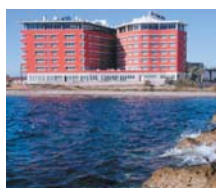
Águilas HOTEL PUERTO JUAN MONTIEL ****

"ESCAPADA RELAX/CULTURAL" PRECIOS POR PAX/PAQUETE ✓ INCLUYE 2 NOCHES AD en habitación doble. ● 1 circuito Spa. 1 entrada museo y teatro romano. ● Todas las visitas y desplazamientos se realizan por cuenta del cliente. ● Horario SPA de lunes a viernes de 07:00 a 22:00 h. Sábados de 17-21 h. Domingos y festivos cerrado. ● Spto. Individual 60 €, excepto 1/7-30/12 60,50 €. ● 1º Niño 0-12 años Gratis y 3ª pax 15% dto.