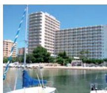
La Manga HOTEL IZAN CAVANNA ****

"ESCAPADA ROMÁNTICA" PRECIOS POR PAX/PAQUETE ✓ INCLUYE 2 NOCHES PC en habitación doble. ● Uso ilimitado piscina climatizada (abierta martes a sábado) ● 1 Bautismo de mar: sólo se prestará a partir de 13/3 hasta el 13/10 (puede ser un paseo en catamarán o iniciación al windsurfing) según disponibilidad de la escuela ● Agua y vino incluido en la PC (excepto del 19/6-30/9)