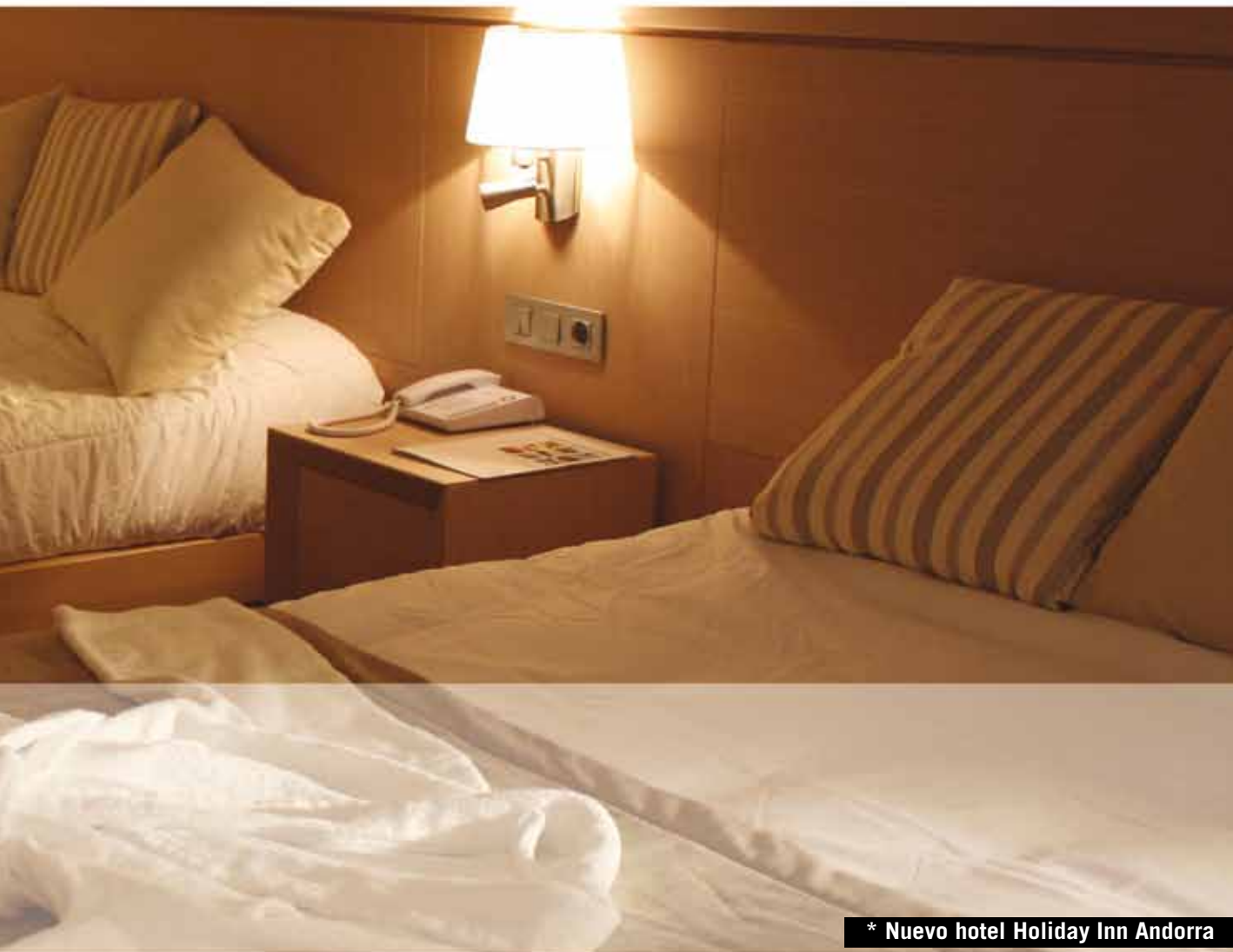
* Nuevo hotel Holiday Inn Andorra